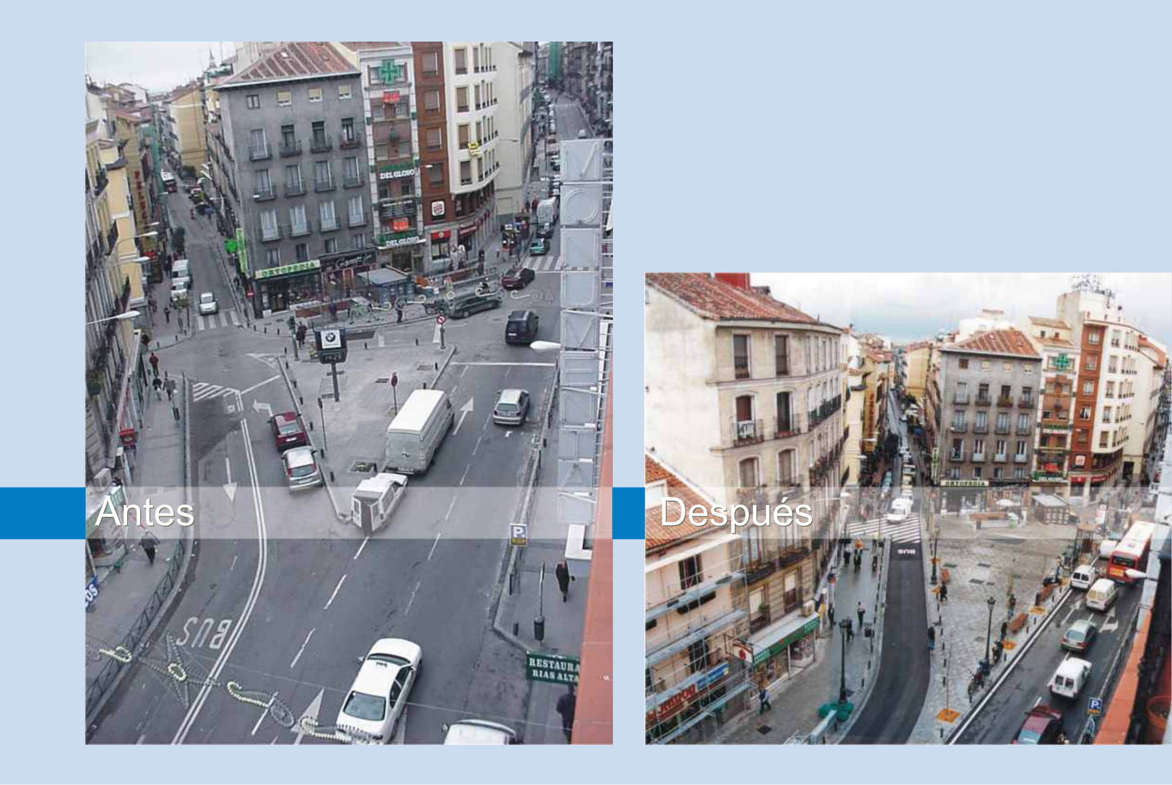
Plaza de Antón Martín

El único material empleado para la pavimentación de uso peatonal es el granito, por su excelente comportamiento frente a las exigencias climáticas y durabilidad. Sus cualidades en cuanto a versatilidad, color y texturas, y la carga de nobleza que otorga a los acabados, lo hacen el material ideal en su diálogo con los basamentos de muchos de los edificios históricos existentes en el ámbito.